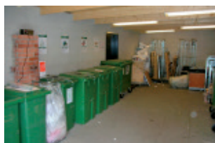
AirMaid® i soprum