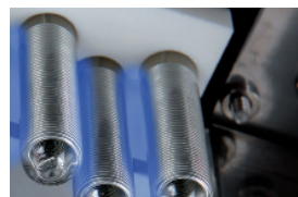
CGC "Corona Glass Cell"

CGC teknologin har funnits på marknaden sedan 1996.