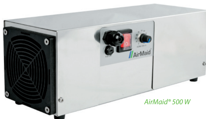
AirMaid® 500 W